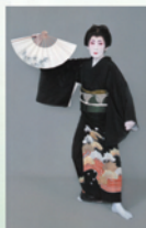
ぎょくしゅん かつら